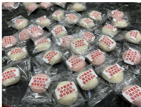
当製造所の紅白餅も配布しました