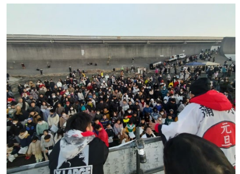
集まった大勢の人々

日本軽金属グループでは、今後も地域の皆さまから愛される企業を目指して、グループが持つ資源を有効に活かし、当グループらしい社会貢献活動を通じて地域社会の発展に貢献します。