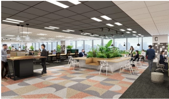
【例1】『アルミナ』『スラブ・板』『加工製品』 など当グループの商品のイメージを施した フロアデザイン

この目的を果たすため、オフィス作りにあたっては企画段階からグループ各社の若手社員でワーキングチームを結成しました。当該チームが中心となり、従業員からのアイデアを募り、執務室のレイアウト、オフィス家具、オフィス運用ルール、社員食堂の名称や食器ひとつまで、すべてにおいて“従業員が自ら作ったオフィス”となっています。